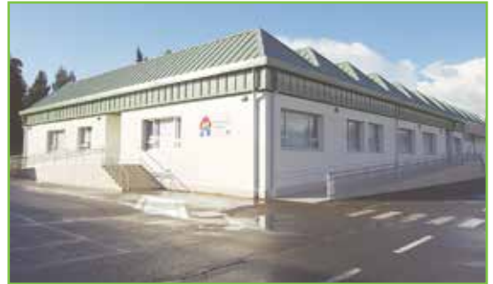
Centro de Día Lamastelle

En el Centro Laboral Lamastelle convivimos: