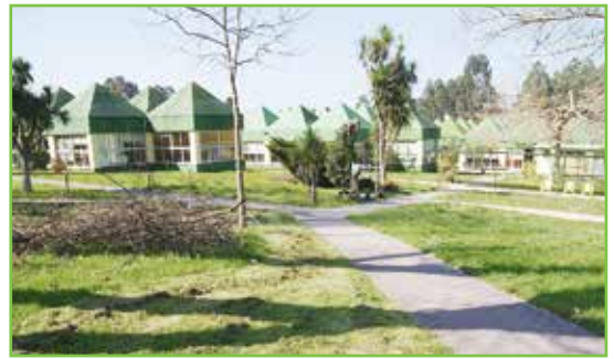
Centro Ocupacional Lamastelle

Estamos muy contentos en el Centro Laboral Lamastelle. Descubre en estas páginas ¡todo lo que hicimos en el 2019!