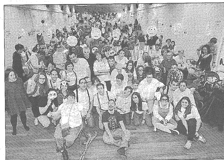
Algunos de los participantes en el festival.