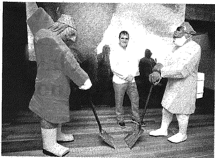
La muestra se compone de veinte piezas

La organización humanitaria tiene otros medios de financiación, como las campañas para captar socios que se realizan durante el año, pero incluso los que no se animan a contribuir de esta manera, lo hacen cuando se trata del Sorteo. Son casi 150 años al servicio de las personas desfavorecidas en A Coruña, y ése es un oro que no pierde su brillo. ■