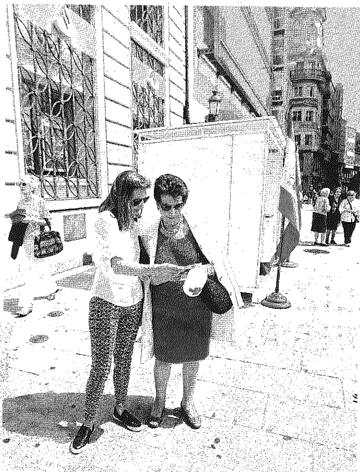
Los Cantones fue uno de los lugares escogidos

Por supuesto, como se suele decir, no es por el oro, sino por las personas. Como recuerdan los voluntarios, por cada boleto de cinco euros que se compre Cruz Roja podrá entregar un kit básico de higiene para una persona. Dos